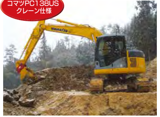
コマツPC138US クレーン仕様