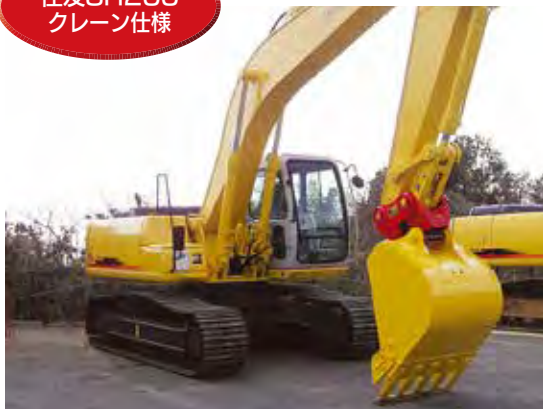
住友SH200 クレーン仕様