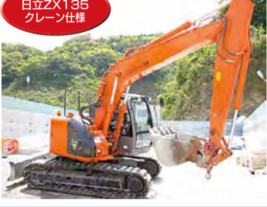
日立ZX135 クレーン仕様