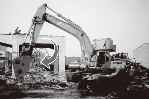
■ブレイカー使用 (コベルコ SK320)