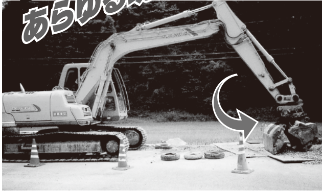
■回転バケット (コベルコ SK200)