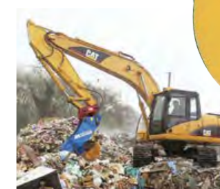
マステイコ(粉碎機)装着