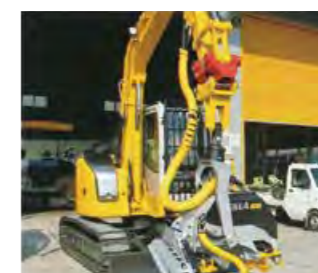
ケスラーハーベスター装着