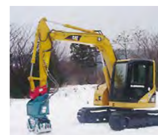
イワフジラップル装着